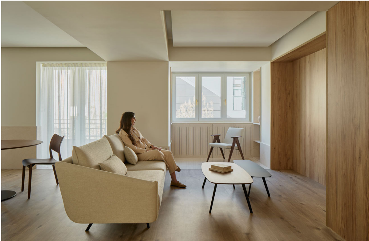
APARTAMENTO CALASANZ. 2024