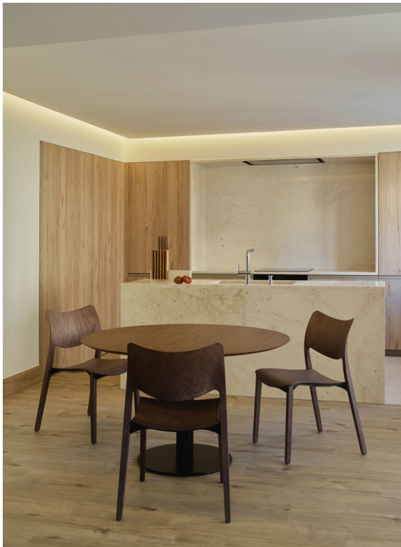
APARTAMENTO CALASANZ. 2024