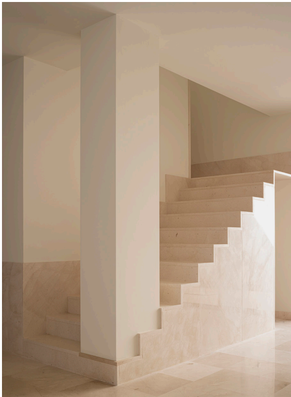
CASA DEL LIMONERO. 2021