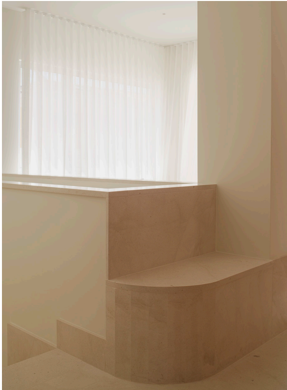
CASA DEL LIMONERO. 2021