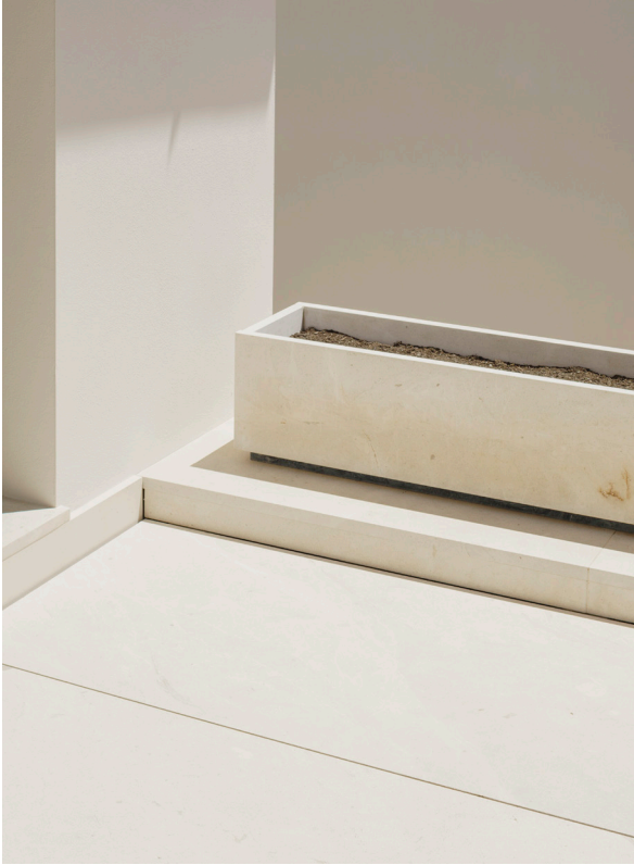
CASA DEL LIMONERO. 2021