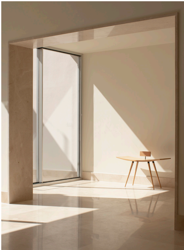
CASA DEL LIMONERO. 2021