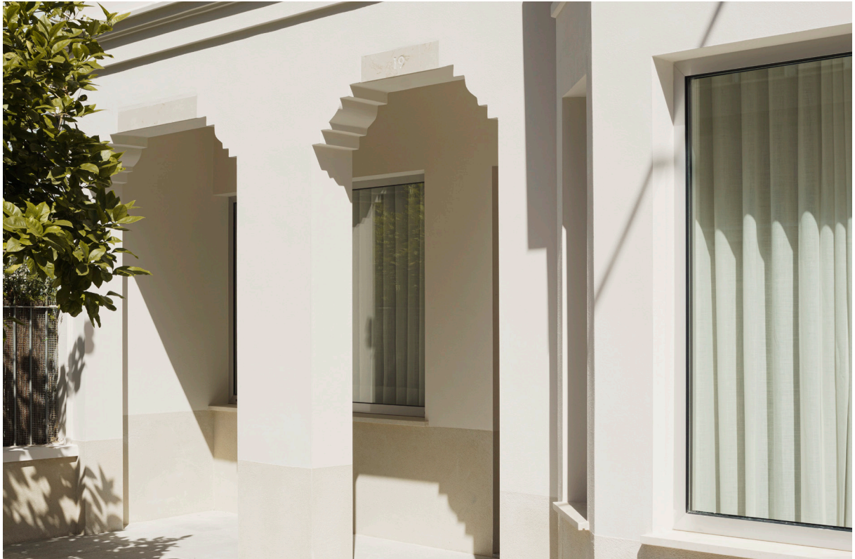
CASA DEL LIMONERO. 2021