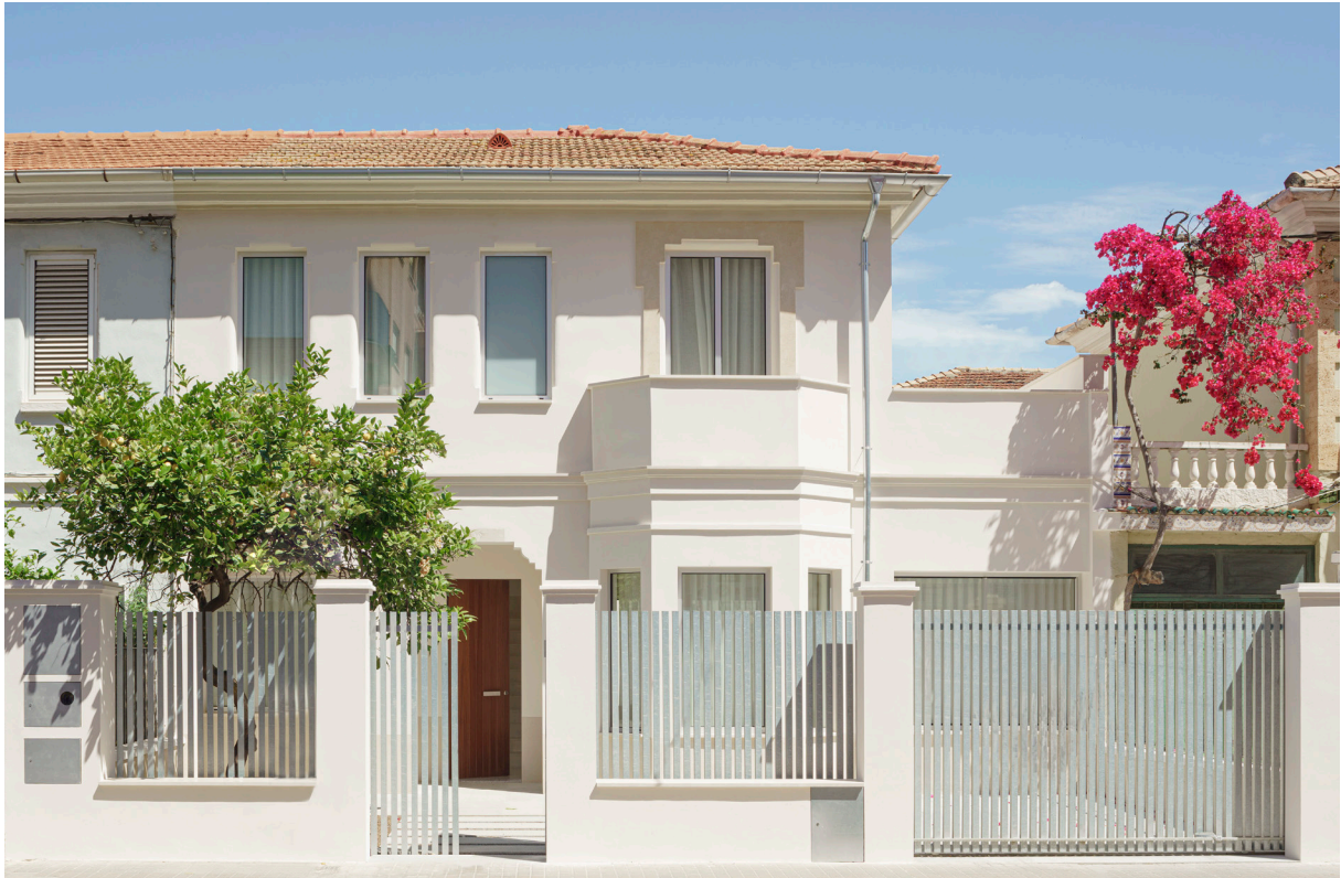
CASA DEL LIMONERO. 2021