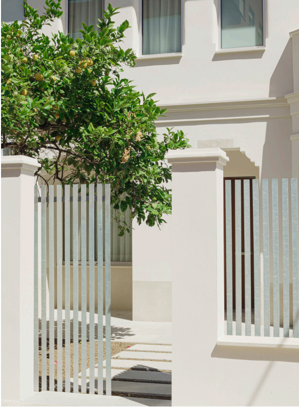
CASA DEL LIMONERO. 2021