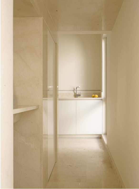
CASA DEL LIMONERO. 2021