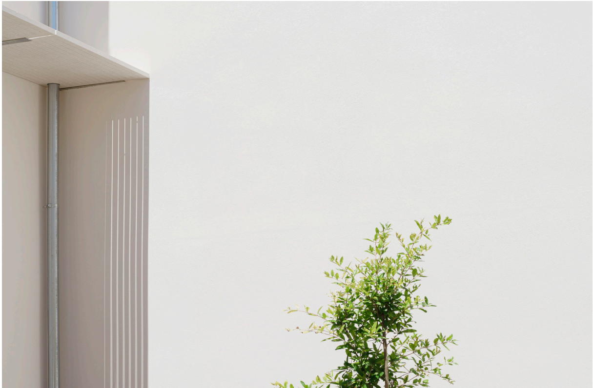
CASA DEL LIMONERO. 2021