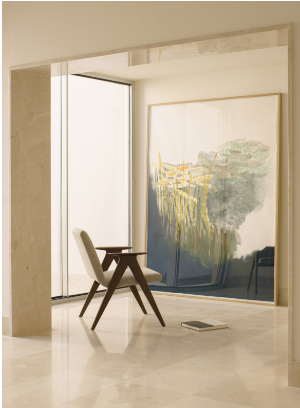
CASA DEL LIMONERO. 2021