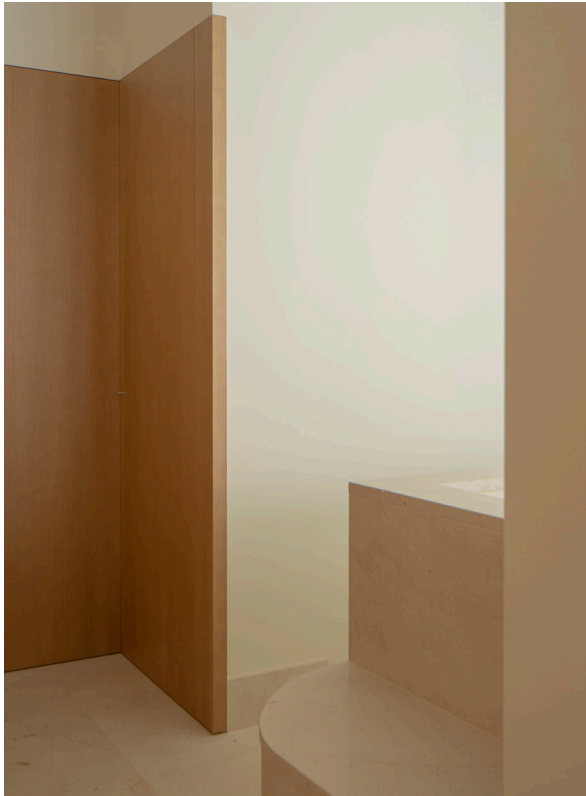
CASA DEL LIMONERO. 2021