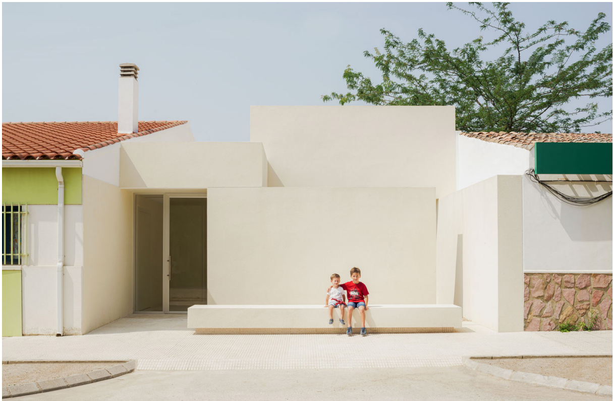
ESCUELA INFANTIL, 2023