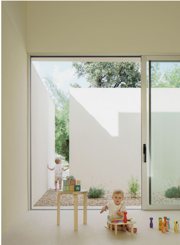
ESCUELA INFANTIL, 2023