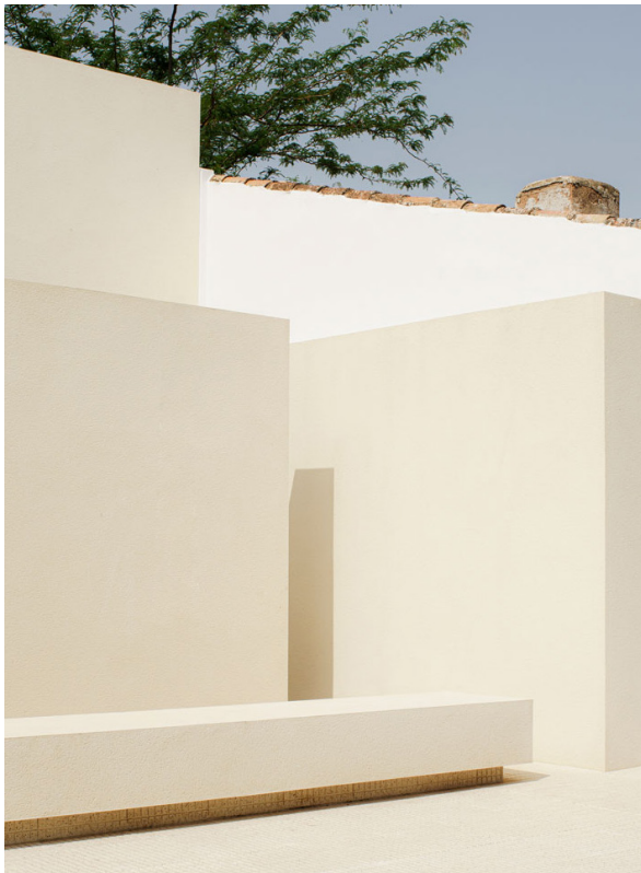
ESCUELA INFANTIL, 2023