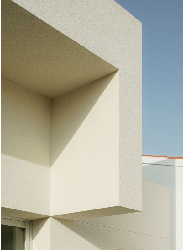
ESCUELA INFANTIL, 2023