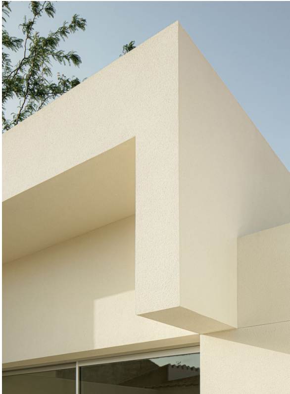
ESCUELA INFANTIL, 2023