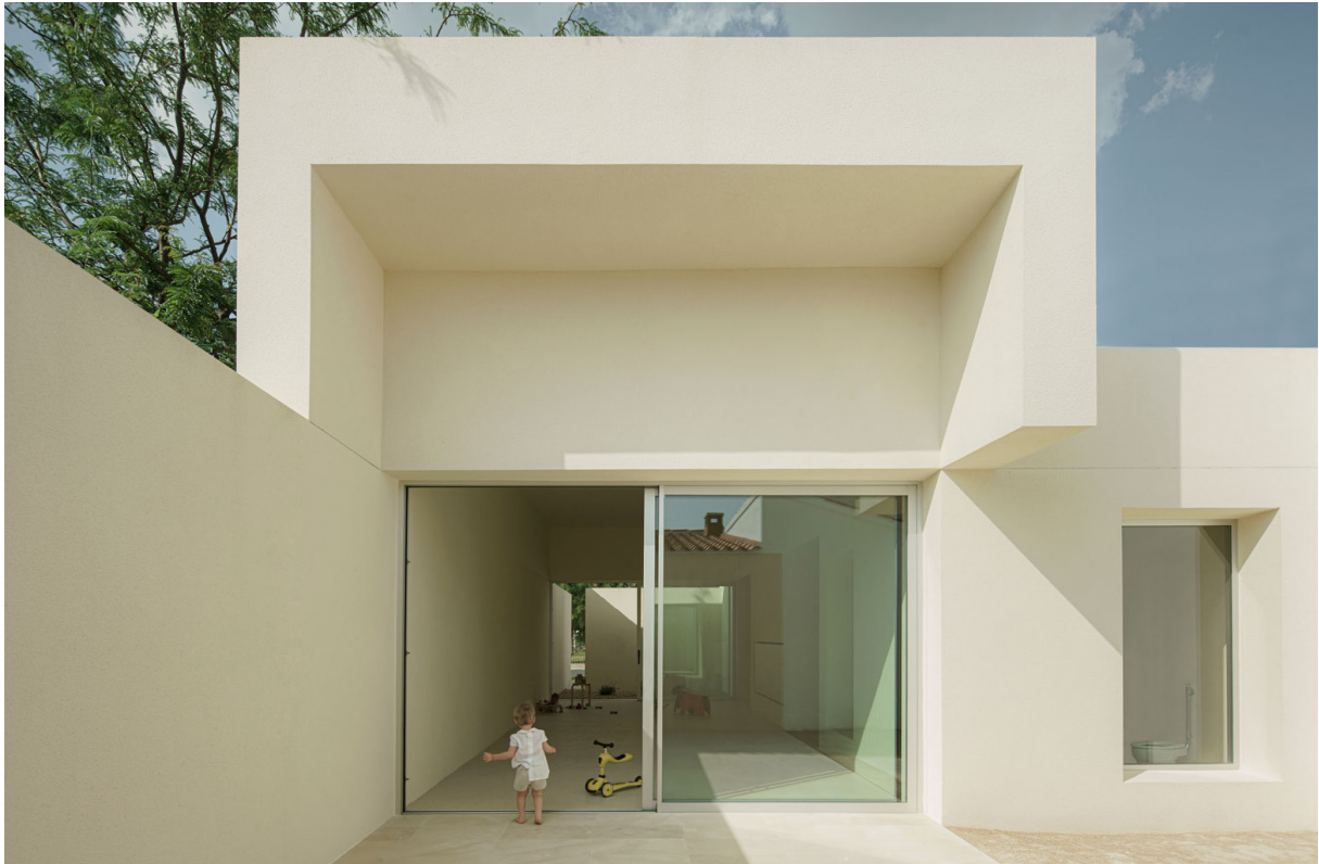
ESCUELA INFANTIL, 2023