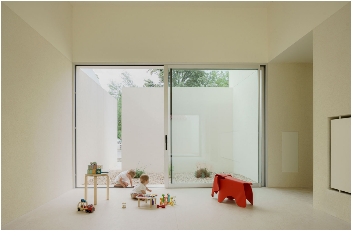
ESCUELA INFANTIL, 2023