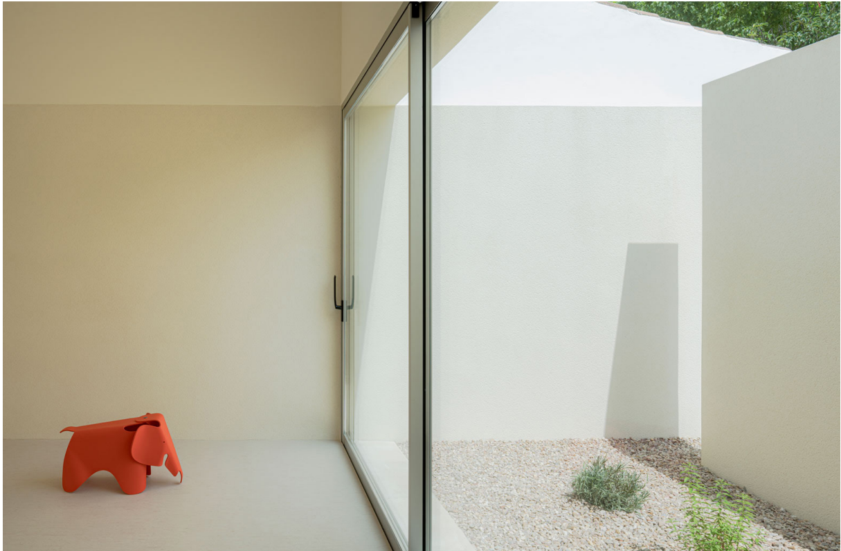
ESCUELA INFANTIL, 2023