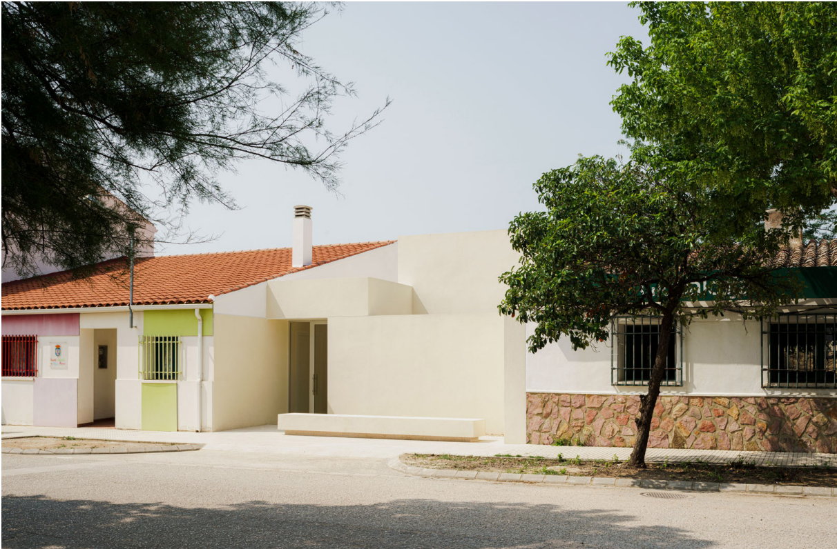
ESCUELA INFANTIL, 2023