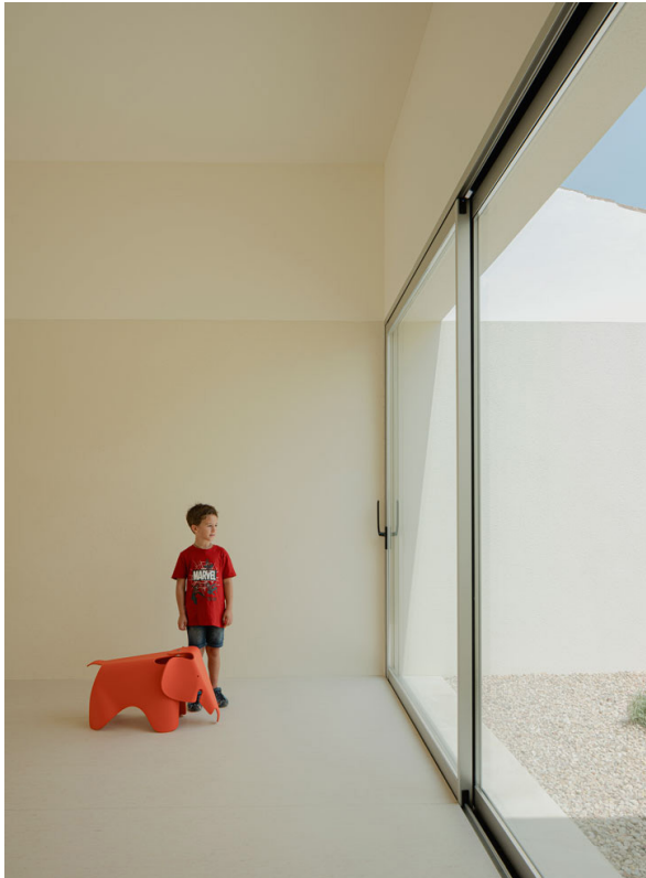
ESCUELA INFANTIL, 2023