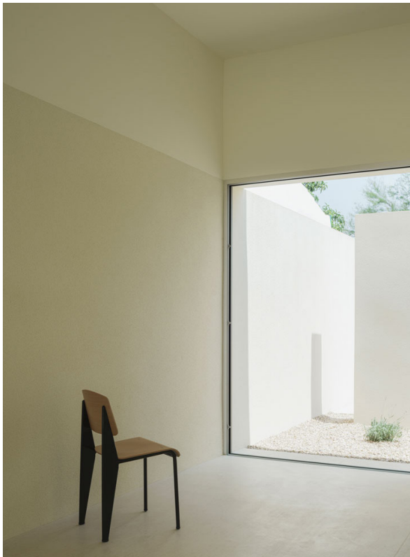
ESCUELA INFANTIL, 2023