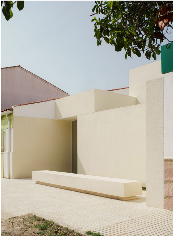
ESCUELA INFANTIL, 2023